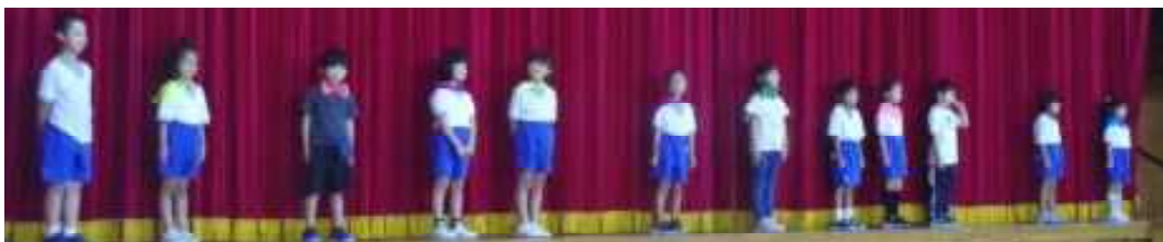
1年生の 元気な あいさつで スタート！