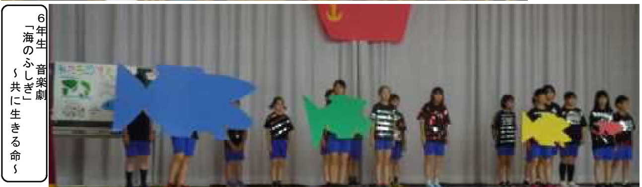
6年生 音楽劇 「海のふしぎ」 「共に生きる命」