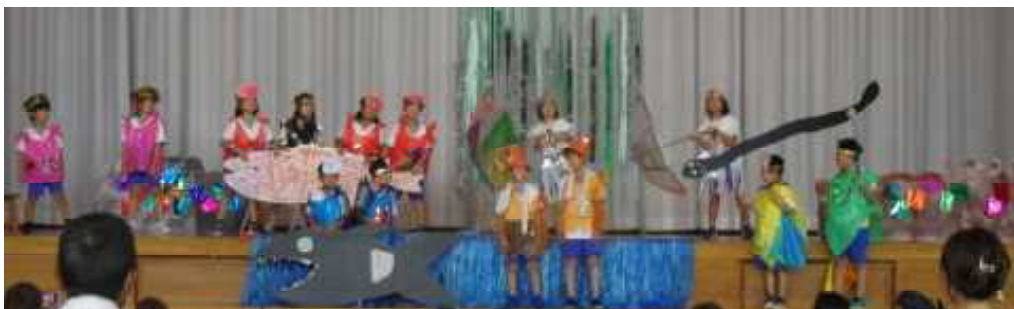
2年生 劇 ぱわふる劇団 「スイミー」