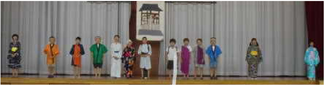
3年生 劇 「寿限無」