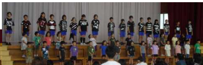
全校合唱 「青い空に 絵をかこう」