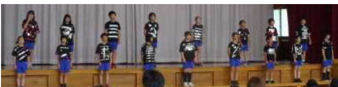
6年生 感謝の気持ちを込めて、お家の方への あいさつ