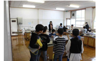
料理手芸クラブ見学