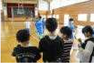
スポーツクラブ見学

今週の月曜日に、来年度からクラブの活動に参加する3年生が、先輩たちの活動ぶりを見学しました。どのクラブもそれぞれに面白さがあり、3年生の子どもたちは、来年度4年生になったとき、どのクラブにしようかと興味深げに見ていました。真剣な眼差しで見学している3年生の姿が印象的でした。