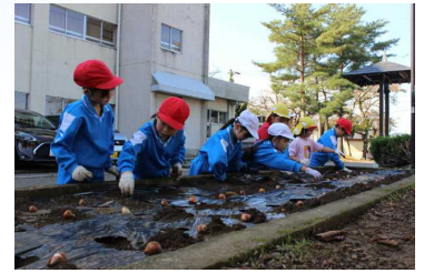
保育園のお友だちと一緒に協力しながら、丁寧に植えることができました

※この日の昼休みの時間を利用して、3・4年生の子どもたちがプランターへの球根植えをしてくれました。