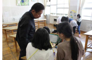
クラフトクラブ見学