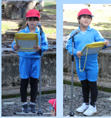
2年生が会の進行を がんばりました。

先週の金曜日の10月25日(金)の3校時に、1・2年生が内小友保育園の年長さんと一緒に、児童玄関前の花壇にチューリップの球根を植えました。毎年、公益財団法人コメリ緑育成財団より球根をいただいております。今年も植え付け作業の際にはコメリの職員の方が来校し、植え付けの仕方を教えてくださいました。