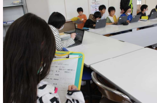
パソコンクラブ見学