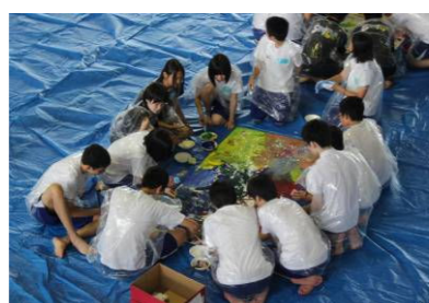
(共同制作をしている様子)