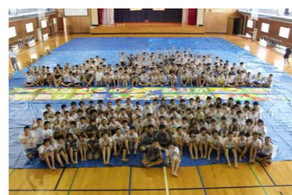
(両校生徒の記念写真)

9月2日(火), 3日(水)の2日間, 本校3年生66名, 校長, 3年部職員5名, 養護教諭の計73名で気仙沼市を訪問した。1日目, 10時30分頃, 開館して間もない「シャークミュージアム」に到着し, 地震直後の気仙沼の様子を映像や写真で見て, 改めて地震の恐ろしさを実感した。その後, 「リアス・アーク美術館」を訪問し, 実際の被災物や写真を見た。午後から, 小原木中学校体育館を会場に, 校庭に建てられた仮設住宅の方々32名をお招きして, 「ロックドンパン」「ヤートセ」「吹奏楽部によるアンサンブル」「抹茶のお手前披露」「合唱」を披露し, 仮設住宅のみなさんと交流して親睦を深めることができた。また, 夜は「街づくり・防災」, 「仮設住宅・住宅再建」というテーマで, 地元NGOシャンティ国際ボランティア会の方々から講話をいただき, 震災時の生々しい映像を見せていただき, 復興に向けての課題等について学んだ。