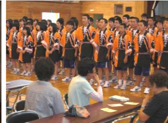
(住民と交流している様子)