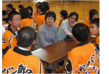
(住民と交流している様子)

2日目, 3班に分かれて, 大谷小・中学校仮設住宅(住民31名参加), 天ヶ沢仮設住宅(住民15名参加), 小泉中学校仮設住宅(住民30名参加)をそれぞれ訪問して, 「ロックドンパン」「ヤートセ」「吹奏楽部によるアンサンブル」「抹茶のお手前披露」「合唱」を披露し, 仮設住宅のみなさんと交流し, 親睦を深めることができた。生徒たちは, 直接被災された方々からお話をお聞きすることで, 新聞やテレビでは感じられない多くのことを学んだ。