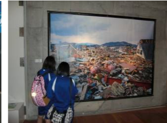
(リアス・アーク美術館)