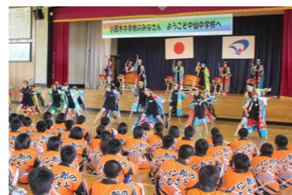
(小原木ソーランを見学している様子)