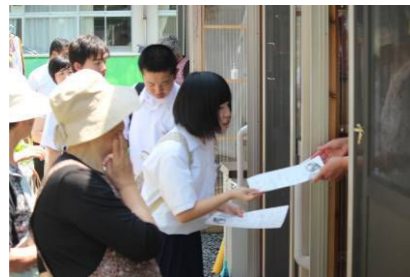
(各仮設住宅で, 9/2,3の案内配布の様子)