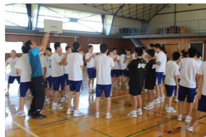
(PAで一緒に活動している様子)

8月29日(金)に小原木中学校は全校生徒28名, 職員11名をお招きし, 交流活動を行った。学年ごとにプロジェクトアドベンチャーを行い, 親睦を図った。その後, 各クラスに小原木中学校の生徒を招き, 一緒に給食をとった。午後からは, 両校の学校紹介を行った後, 小原木中学校から全校生徒による「小原木ソーラン」を, 中仙中学校が訪問生徒全員による「ロックドンパン」を披露し合った。ダイナミックで勇壮な「小原木ソーラン」の太鼓と舞には, 本校の生徒, 職員ともに圧倒された。「ロックドンパン」では, 小原木中学校の生徒も一緒に踊るなど, 大いに盛り上がった。最後に両校の生徒たちで, 協力して制作活動を行うことで絆を深めることができた。