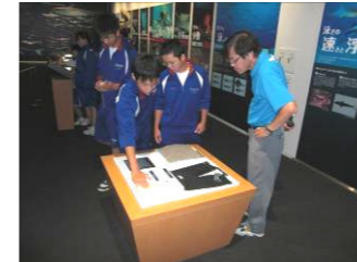
(シャークミュージアム)

9月2日(火), 3日(水)の2日間, 本校3年生66名, 校長, 3年部職員5名, 養護教諭の計73名で気仙沼市を訪問した。1日目, 10時30分頃, 開館して間もない「シャークミュージアム」に到着し, 地震直後の気仙沼の様子を映像や写真で見て, 改めて地震の恐ろしさを実感した。その後, 「リアス・アーク美術館」を訪問し, 実際の被災物や写真を見た。午後から, 小原木中学校体育館を会場に, 校庭に建てられた仮設住宅の方々32名をお招きして, 「ロックドンパン」「ヤートセ」「吹奏楽部によるアンサンブル」「抹茶のお手前披露」「合唱」を披露し, 仮設住宅のみなさんと交流して親睦を深めることができた。また, 夜は「街づくり・防災」, 「仮設住宅・住宅再建」というテーマで, 地元NGOシャンティ国際ボランティア会の方々から講話をいただき, 震災時の生々しい映像を見せていただき, 復興に向けての課題等について学んだ。