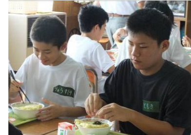
(クラスで一緒に給食を食べている様子)