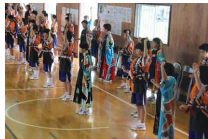
(ロックドンパンを踊っている様子)