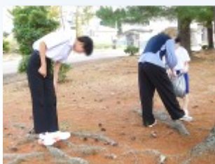
前庭で松ぼつくりを採集

装飾部門 装飾部門の初日は、校内装飾に使用する材料集めからスタート。前庭で集めた松ぼつくりを煮沸消毒しました。どんな装飾ができるのか楽しみです。