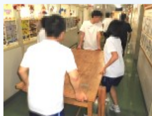
4人がかりで机を移動

進行・舞台部門 こちらは、体育館に技術室の大きな机を移動。続いて、お客様用のパイプ椅子の状態を確認しました。なるべく良い状態の椅子を準備できるように選別しています。