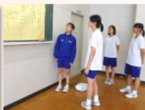
2年生は情報センターでパート練習