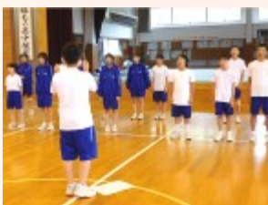
体育館で練習する1年生

合唱練習 部門活動とともに、合唱の練習にも熱がこもっています。今週からは、帰りの会後に毎日20分の練習時間を確保するとともに、音楽室や体育館、情報センターの使用割りを決めて、練習に励んでいます。どの学年も順調に練習が進んでいるようでした。