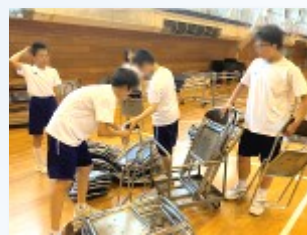
椅子の状態を点検

合唱練習 部門活動とともに、合唱の練習にも熱がこもっています。今週からは、帰りの会後に毎日20分の練習時間を確保するとともに、音楽室や体育館、情報センターの使用割りを決めて、練習に励んでいます。どの学年も順調に練習が進んでいるようでした。