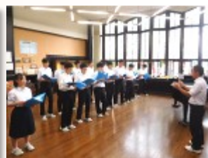
3年生は音楽室で練習

これまで度々紹介させていただいた、小中連携活動の「あさがお運動」ですが、今年の活動も9月27日(金)の活動をもって終了となりました。