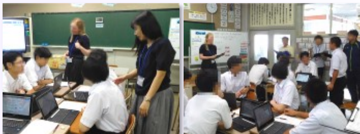
先生方に見守られてのグループ協議(左)と自分の考えをALTの先生に向けて発表(右)

授業では、支援策とそれをどう英語で伝えるかについて個人で考えたことをグループで伝え合い、足りない情報等を補足し、ALTの先生に評価していただきましたが、みんな具体的な支援策を考え、発表することができていました。また、熊谷先生のスピード感あふれる授業に全員がしっかりついてきていること、自分の考えをできるだけ英語で伝えようとしていることなど、3年生にふさわしい力が身に付いていることに感心しました。