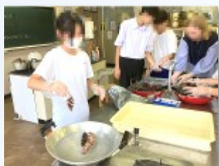
松ぼつくりを煮沸消毒

進行・舞台部門 こちらは、体育館に技術室の大きな机を移動。続いて、お客様用のパイプ椅子の状態を確認しました。なるべく良い状態の椅子を準備できるように選別しています。