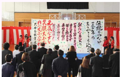
書道パフォーマンス完成作品