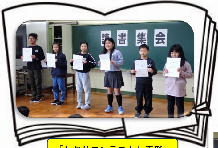
「しおりコンテスト」表彰