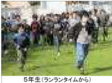
5年生(ランランタイムから)