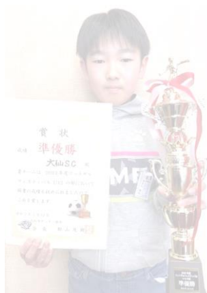
2024年度フットサルフェスティバルU12 準優勝 大仙SC