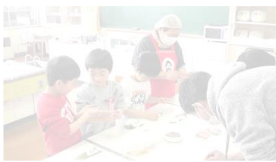
1年生 「ささっぱもちをつくらう！」

2月も今週でおしまいとなります。3月の学習日は残り14日(卒業生は11日)です。なにとぞ最後までご支援をよろしくお願いいたします。