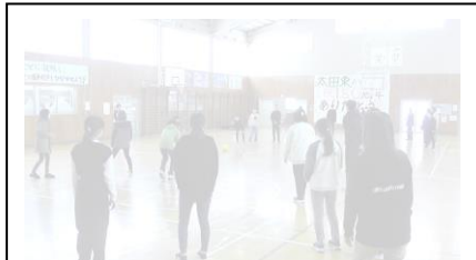
6年生 「6年間ありがとうの会」