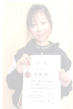
2025大台大回転(タミヤカップ)スキー大会 小学校1~3年 第3位

今年度いただいた子どもたちの賞状は、数えてみると六〇枚もありました。大活躍です。賞状に表れなかった活躍も含めて、子どもたちの努力を大いにたたえたいと思います。