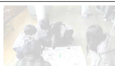
2年生 「できるようになったこと」