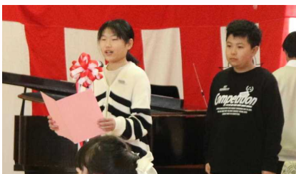
〇〇さんと〇〇さんの司会の様子