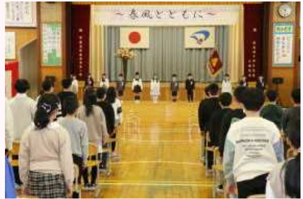
立派な態度で式に臨む1年生