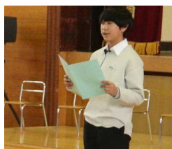
〇〇さん歓迎のことば