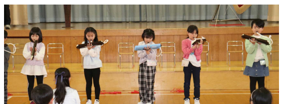
2年生のピアノでの発表の様子