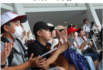
イルカショーに釘付け