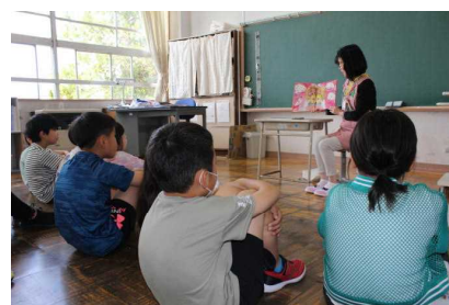
3年生の読み聞かせの様子

今週の19日(水)の朝に、3年生の子どもたちへ「ぼけっと」 さんのメンバーである〇〇〇〇さんが読み聞かせをしてくだ さいました。今回読んでいただいたのは、「たなばたさま」「まん てんべんとう」という2冊の絵本です。〇〇さんの臨場感あ ふれる読み聞かせに、どんどん絵本の世界に引き込まれている子 どもたちの姿が見られました。また、お母さんが熱を上げてお 弁当をつくることができなくなり、コンビニでハンバーグ弁当 を購入した「まんてんべんとう」の話は、とても感動するもの でした。次回は、26日(水)の4年生となります。