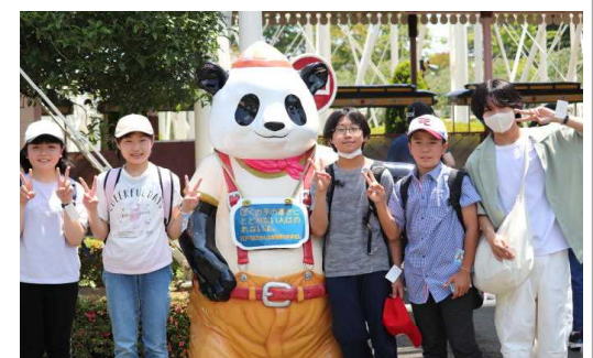
八木山ベニーランドにて