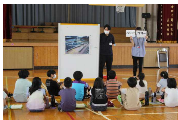
バリアフリーの説明

今週の19日(水)、大仙市社会福祉協議会や地区民生委員の皆さんに ご来校いただき、4年生を対象に「菜のはなタイム」を実施しました。 「菜のはなタイム」は、バリアフリー体験活動を通してハンディキャ ップがある生活について考え、バリアフリー社会に対する意識を一層 高めることをねらいとしています。