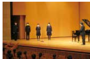
＜代表生徒による質問タイム＞