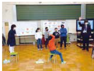
<中学校教員が入っての外国語活動>

最近では高校とも同じような考えをもって連携を進めている。何よりも管理職のこのことに関する理解と実践力が本メソッドの大きな支えとなっている。