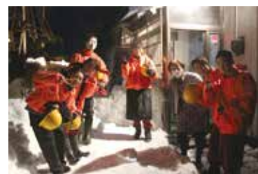
＜12/23 大仙雪まる隊として＞

部員の原動力となっているのは、お年寄りをはじめとする皆様からいただく笑顔、そして「ありがとう」の言葉。彼らは「自分たちが誰かの力になれるという自信がついた」「助け合えるのが本当の強さだと思うようになった」「ボランティアを行うようになってからは、学校生活でも相手のことをよく考えて行動するようになった」と、日々の活動を振り返る。カラダとココロで感じる部活動をこれからも展開していきたい。