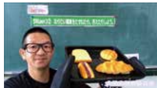
＜教育専門監による動画＞

来年度は児童生徒に一人一台のタブレット端末が配付され、万が一の際には自宅で活用できる環境も整う予定だが、学校とはこれまで以上に連携を図りながら、子どもたちの学習保障に努めていきたい。