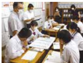
＜太田中学校の様子＞

先生方の自主的な研修に市教委指導主事がお手伝いする目的で今年度からスタートした「課題解決セミナー」。今後も課題解決のお手伝いをさせていただきます。お気軽にお声がけください。