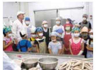
<大仙ふるさと博士育成事業企業見学day>

大仙教育メソッドは学校（児童生徒）を核とした取組だが、地域を学びの場として、子どもたちばかりでなく、大人（市民）もふるさとの素晴らしさを実感できる取組を進める「大仙まるごと楽園」を構築していきたいと考えている。そのためにも教育委員会ばかりでなく、市の企画部や経済産業部等と連携した取組、例えば一度は参加したいふるさと観光巡りや企業見学、地域産業出前授業・講座などを開拓し、市民、学校が活用できる仕組みを構築したいものである。