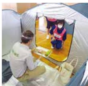
＜避難者への食事の提供＞