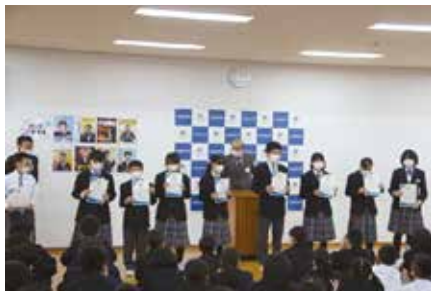
＜教育長より上級認定 (校内にて)＞

取組を通じて、生徒たちは地域のことを詳しく知り、いろいろな体験ができたことで、地域に貢献できた、人の役に立てた喜びを実感できたようである。今後も、地域との連携を深め、地域の文化発信拠点としての学校でありたいと思う。