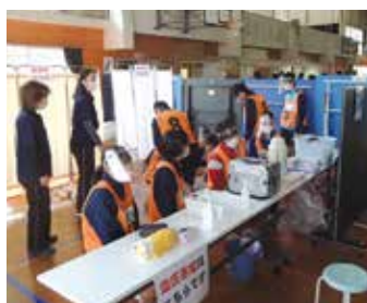
＜救護・保健衛生班の活動＞

「チーム南中」を合い言葉に、市当局や関係機関、地域の皆様のご協力の下、学校と地域の協働による訓練を見事成功させた。生徒は事前集会や本番の訓練を通して事業のねらいに近づくことができた。また、コロナ禍で学校と地域との連携・協働が制限される中、今回避難所開設訓練を実施したことで、地域に貢献することができた。