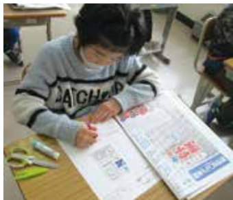
＜新聞タイムの様子＞

新聞を読むだけでなく「新聞タイム」で書くことによって、情報の理解が確かになり、意見の交流ができています。