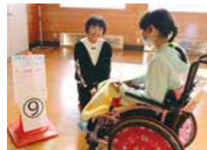
＜交流学習 ハローの会＞