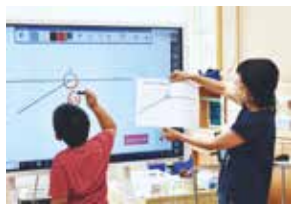
＜算数 角度の学習より＞

特に自閉症・情緒障害学級では、ほぼ全単元で活用し、児童とのやりとりを電子黒板上で行って共通理解したり、国語の長文では区切りながら提示することで苦手意識を軽減したりしてきた。また、学習した画面を保存し、単元の終わりの学習の振り返りにも活用した。