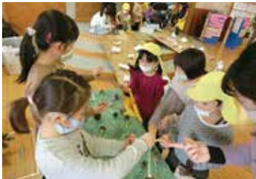
<1年おもちゃランド>