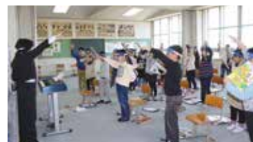
＜フェイスシールドを付けての授業＞