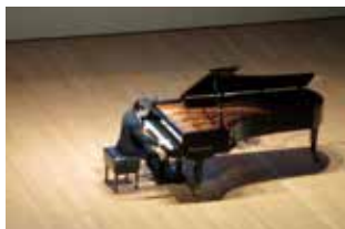
＜演奏中の佐藤卓史氏＞

時代背景や作曲家の説明を聞いてイメージを膨らませた生徒たちは、ホールに響き渡る美しい楽曲とピアノの音色に心を奪われていた。最後には、夢の実現に向けて努力する大切さなどのお話をいただいた。後日、生徒の感想には、演奏のすばらしさはもちろん、自分の進路や夢について大きな励みになったとの声が綴られていた。