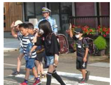
さん( 鉄工所)が見守る中での登校

また、夏休み中も交通安全に気を付けて過ごすことができるよう、ご家庭でも声かけをよろしくお願いいたします。(特に、飛び出し禁止や自転車に乗る際のヘルメット着用など)