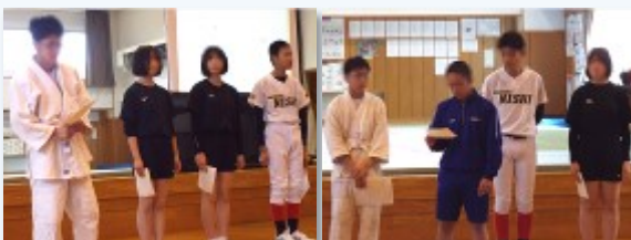
説明する専門委員長の皆さん

前半の「生徒会入会式」では、生徒会執行部や各専門委員長が、生徒会の組織についての説明や、各委員会の活動内容、どんな人に入ってほしいかなどについてお話してくれました。