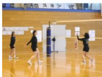
バレーボール部と卓球部は練習を実演