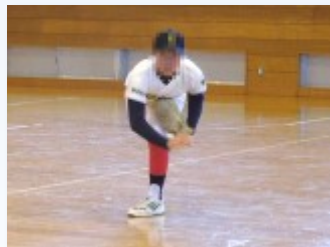
野球部はピッチングを披露

今回の説明を受けて決まった委員会活動や部活動が、来週からスタートします。各委員会、部活動で全校生徒が力を発揮してくれることを期待しています。