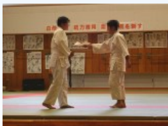
柔道部は寸劇でプレゼン

新入生のみんなは、2月の新入生説明会で部活動体験をしてきたこともあり、既に入部する部活動を決めている人もいたとのことでしたが、みんな大変興味深そうに聞き、各部の発表に盛大な拍手を送っていました。