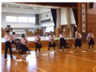
吹奏楽部は「ジャンポリミッキー」を振り付きで披露