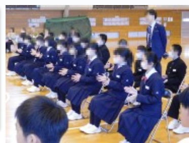
先輩たちの発表に拍手を送る1年生