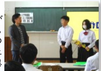
代表生徒のお礼の言葉