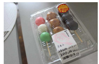
リアルを追求した団子

社会の授業とリンクさせて、3つのヒントから何県かを当てるカルタ、ジオラマ、パッケージにも工夫を凝らした団子など、どの作品も子どもたちの頑張りが見られ、素晴らしいものばかりでした。作品制作にあたり、ご家庭のご支援とご協力のお陰で、見応えのある力作がそろいました。本当にありがとうございました。