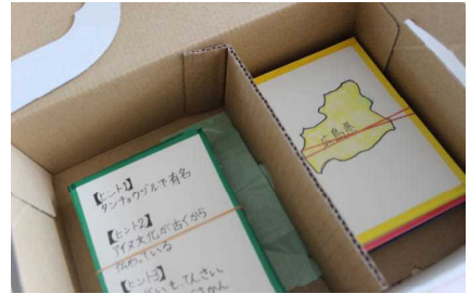
社会とリンクしたカルタ

子どもたちが夏休みに取り組んだ自由研究や工作等の作品が、8月29日（木）まで校内のチャレンジルームで展示されました。