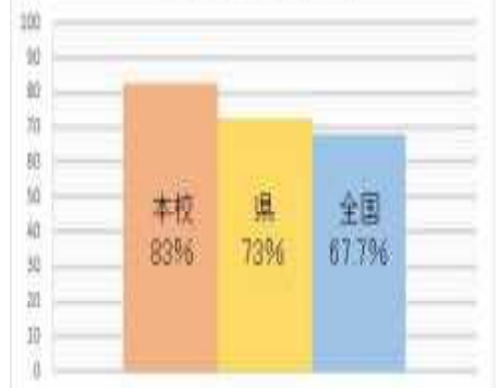
令和6年度全国学力・学習状況調査 平均正答率(国語)