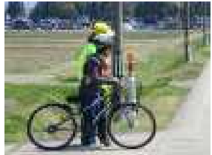
交差点はよく見て横断