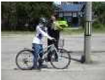
出発時は後方確認