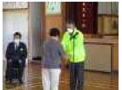
4年生にランドセルカバー贈呈