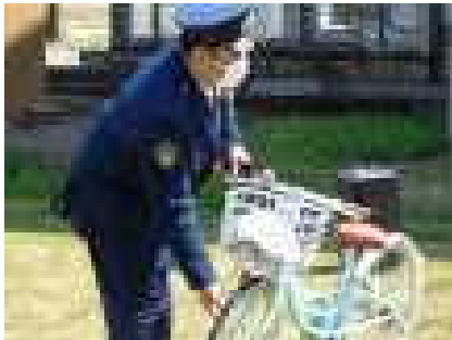
自転車点検の合言葉「ブタはしゃべる」

今回の交通安全教室には、内小友駐在所長の〇〇巡査長様の他、内小友地区交通安全会の〇〇会長さん、交通安全母の会の〇〇〇さん、内小友公民館の〇〇さんにも参加していただき、交通安全についてのお話や実技コースでの児童一人一人への丁寧な指導をしていただきました。加えて、DVDを見ながら交通安全についての意識を高めました。また、交通安全教室終了後、4年生に対してランドセルカバーもいただきました。子どもたちが交通ルールを守った生活ができるよう、引き続き、ご家庭でもお声かけをお願いいたします。