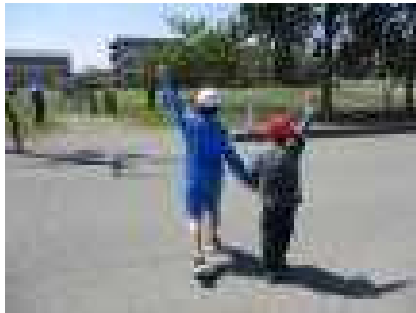
1・2年生は安全な歩き方練習