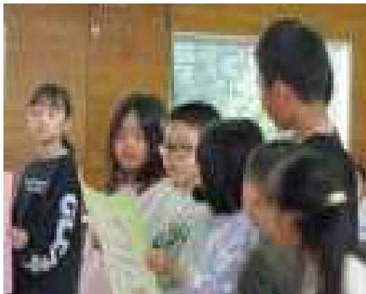
学級目標発表の様子

児童会活動は、子どもたちの自主的な活動意欲を高めることや、友だちや周囲の人々との良好な関係をつくることを目的としています。1年間の児童会活動を通して、子どもたちにそのような力が身に付くよう、これからも力強く支援していきたいと思います。