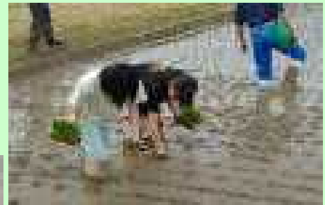
黙々と苗を植える5年生