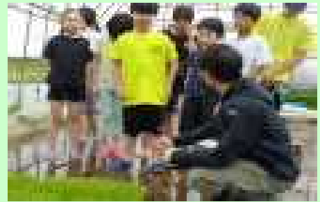
説明を真剣に聞く5年生

そして、いよいよ実習田へ。最初は怖々と田んぼに入っていた5年生でしたが、慣れてきたらどんどん苗を植えることができました。足が抜けずに尻餅をついてしまった児童もいましたが、水田には子どもたちの笑顔と歓声がたくさんあふれていました。