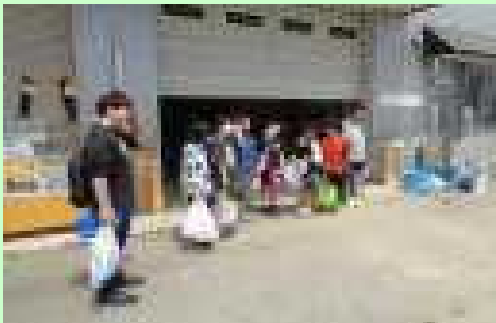
最後はみんなで「ありがとうございました！」