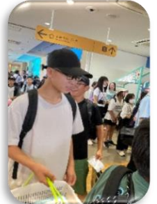
楽しいお土産ショッピング かわいいグッズがたくさん！