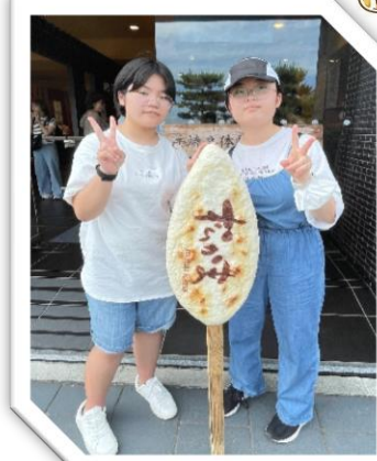
◆ かまぼこ作り体験 ◆