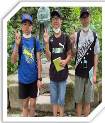
◆ 芭蕉像前にて ◆