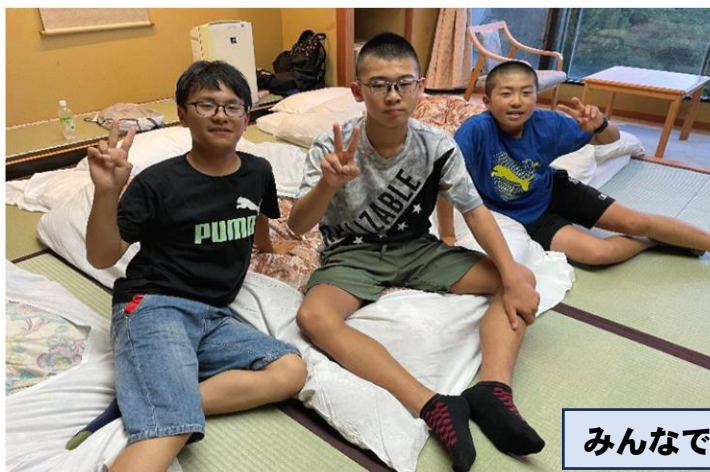
みんなで一晩・・・