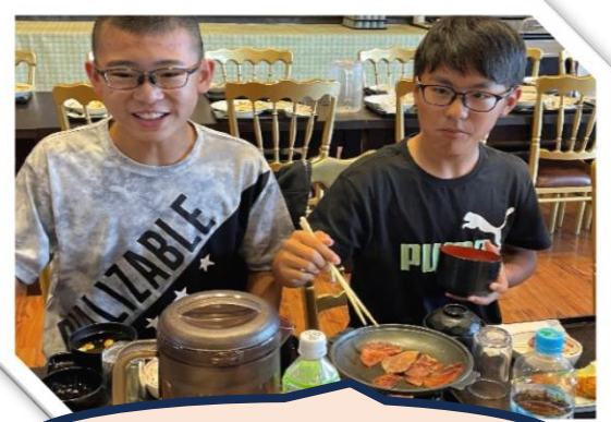
昼食は豪華に牛タン！