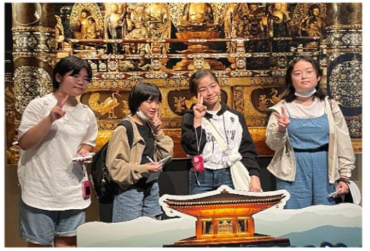
◆◆ 平泉 中尊寺 金色堂 ◆◆ 国宝第1号指定・世界遺産認定