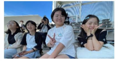
イルカショーに大歓声！