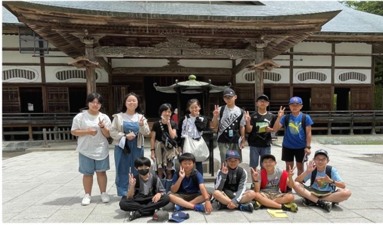
◆◆中尊寺本堂前にて記念撮影◆◆