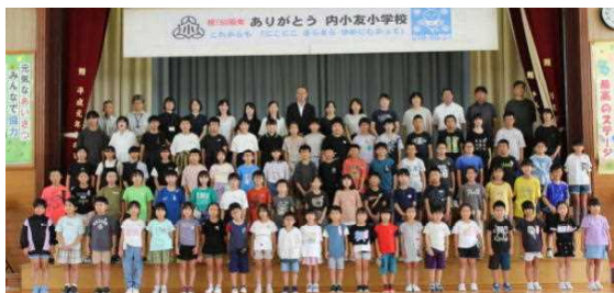
74名の子どもたちと15名の職員と

学習発表会予行の日、150周年記念事業の一つとして全校写真を撮りました。学校に掲示するとともに、子どもたちにも配付する予定です。