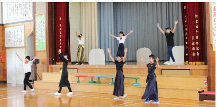
6年生「雲の上の三武将」