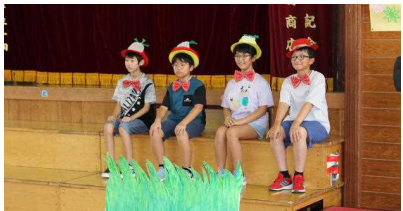
5年生「The Giant Turnip」