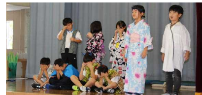
3年生「三年とうげのいたずらおに」