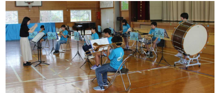
器楽部の演奏の様子

を胸に、本番では最高のパフォーマンスを見せてくれることと思います。学校としても、子どもたち一人一人が、「やってよかった」という達成感や成就感を味わえるような学習発表会にしたいと考えております。当日は子どもたちが笑顔で活躍する姿をごゆっくり鑑賞され、ぜひ温かいご声援をいただきますようお願いいたします。