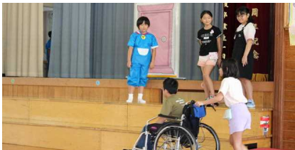
4年生「『ふくし』ってなんだろう」