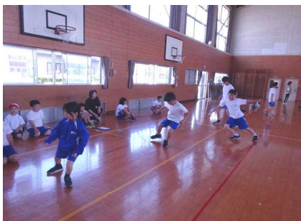
素早く！反復横跳び