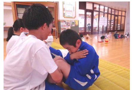
よいっしょ！上体起こし