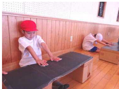
ひざを伸ばして長座体前屈