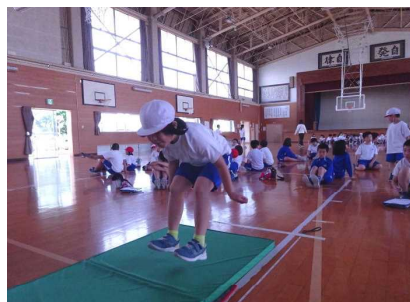
より遠くへ！立ち幅跳び