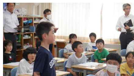
3年 算数…データを分けたり整理したりするには?

先日行われた「書道パフォーマンス」も話題になり、150周年関連行事を通して、「愛校心」を育て、「地域貢献」できる子どもを目指してほしいというお話もありました。