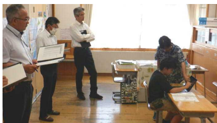
竹組 算数…いろいろな大きさの角ができるね!