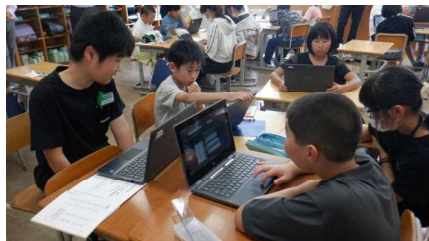
5年 総合…宿泊体験学習のどんなことを新聞にのせようかな