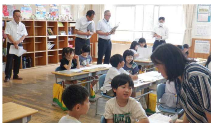
2年 国語…あったらいいなと思っものについて教えてね

参観後は、「発表者をしっかり見て聞いている」「つぶやきや自然な拍手があり、子どもたちや先生の表情がよかった」とたくさんのお褒めの言葉をいただきました。