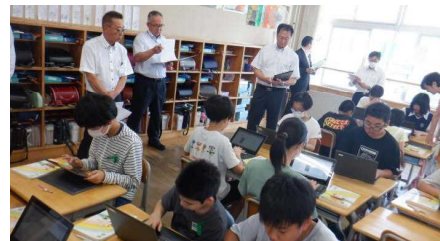
6年 国語…自分の「たのしみ」を短歌に近い形で表現しよう