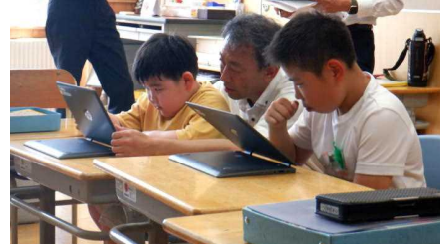
松組 国語…タブレットを使って漢字やひらがなを練習するぞ!