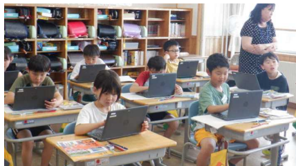
4年 社会科…ごみをへらすために自分ができることは…?