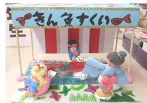
たのしい きん魚すくい