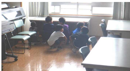
鍵がかかる教室の奥へ 素早く避難します

不審者情報については、大曲中学校区内でも情報共有をすることになっています。不審な人物を見かけたり、声をかけられたりした場合は、すぐにお知らせくださるようお願いいたします。