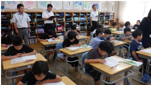
3年 国語 つたえたいことをはっきりさせて、ほうこくする文しょうを書こう