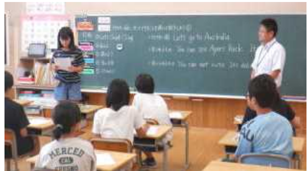
6年 外国語 Let's see the world.