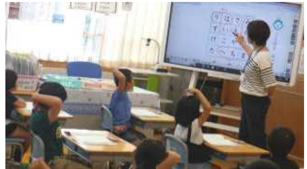
1年 国語 ことばをみつけよう

四ツ屋小の子どもは、「学習のルールが守られており、土台がしっかりしている」「どの学年も、先生の問いかけに真剣に向き合っている」そうです。また、所長様は、懐かしそうに子どもたち一人一人の様子をご覧になり、わずか半年あまりで成長した様子に驚きながらも、とてもうれしそうでした。