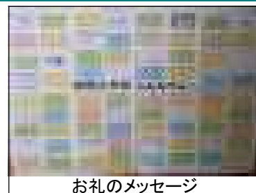
お礼のメッセージ

大槌町との交流は、2014年から続いています。子どもたちの手作りうちわが、今年も大槌町の皆様に、大切に使用いただいていること、とてもうれしく思いました。