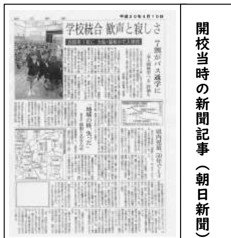
開校当時の新聞記事（朝日新聞）

これまでの16年を振り返ってみると、6つの地域に小学校はなくなってしまったけれど、それぞれの地域の伝統や良さを改めて確認し、それらを大切にしていこうという思いが「協和小学校」という新たな場所で少しずつ形を変えながら、脈々と受け継がれてきたことを感じます。