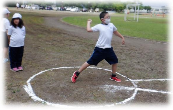
裏面もごらんください。