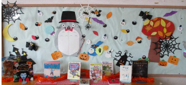
ハロウィン仕様のトトロ^^