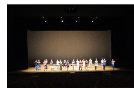
4年生：現地練習の1回目。「和ピア」の客席からはこんな風に見えます。