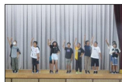
5年生：息の合ったダンスも見どころのひとつです。楽しそうですね。