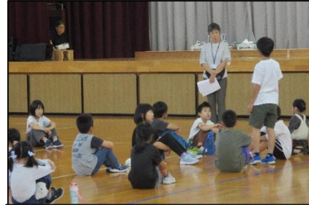
2年生：練習の最後に、今日の練習の振り返りをしっかり行っています。