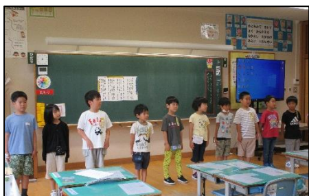
1年生：オープニングの「あいさつ」の練習。長い台詞をがんばって覚えています。