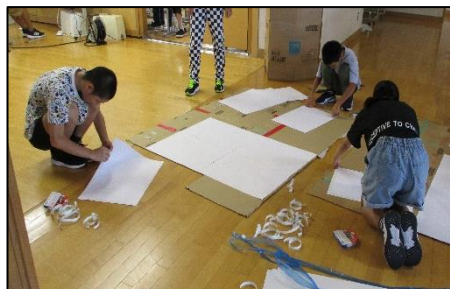
6年生：道具づくりも自分たちで行っています。さすがですね！！

9月24日(火)から「体育館と音楽室」などの使用割り当てを決めて、本格的に準備や練習を始めています。10月12日(土)の本番まではもう少し日にちはありますが、より良い発表を見せることができるよう、どの学年も真剣です。