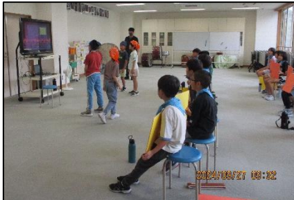
3年生：録画された映像を見ながら練習するなど、工夫しています。