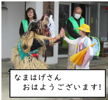
なまはげさん おはようございます!