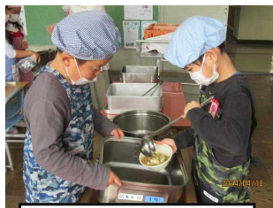
1年生 給食の盛り付けも 上手にできます