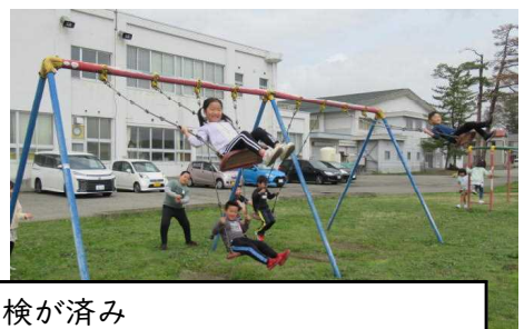
遊具の点検が済み ブランコ遊び解禁!久しぶりのブランコに 笑顔がはじけました