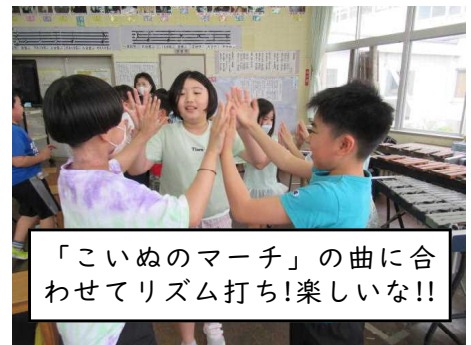
「こいぬのマーチ」の曲に合わせてリズム打ち!楽しいな!!