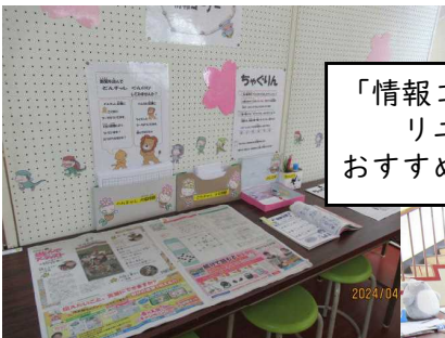
「情報コーナー」が リニューアルオープン! おすすめの記事を紹介し合います