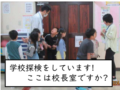
学校探検をしています! ここは校長室ですか?

新学期がスタートして約20日、経過しました。9日に入学した8人の1年生も、日に日に清水小学校に慣れていきます。給食をもりもり食べて、勉強が5時間目まである日も頑張っています。2年生以上の皆さんも生き生きと学習に取り組む姿が見られます。全校児童が安心して「どんチャレ」をスタートしている様子を見るにつけ、嬉しく思っています。この新たな気持ちを忘れないで1年間頑張っていけるように、私たち職員は子どもたちの意欲を大切に、指導支援していきたいと思えます。一方で、疲れがたまってくる時期でもあります。また、インフルエンザや新型コロナウイルスにも油断はできません。「早寝・早起き・朝ごはん」や状況に応じた感染症対策にも留意しながら、健康な毎日を送ってほしいと思っています。