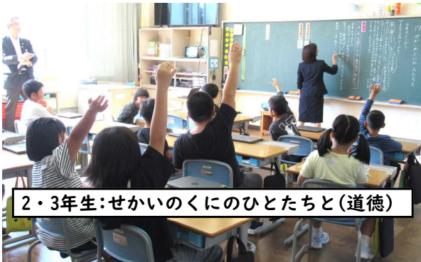
2・3年生:せかいのくにのひとたちと(道徳)