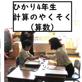
ひかり4年生 計算のやくそく(算数)

26日にメールでお知らせしたスズメバチについて、まだ駆除等の安全が確認されていません。つきましては引き続き、通学路の変更、送迎車の停車位置の確認をお願いします。