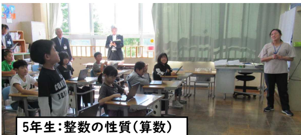
5年生:整数の性質(算数)