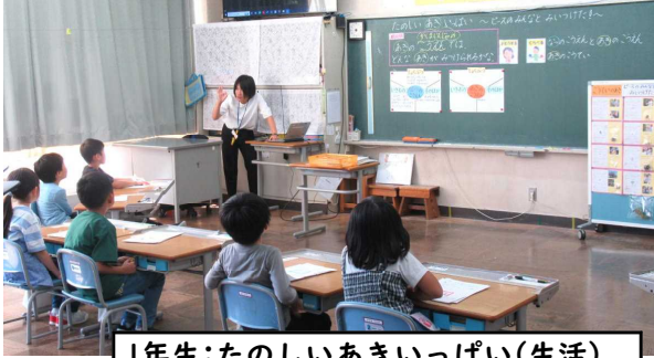
1年生:たのしいあきいっぱい(生活)

25日(水)、大仙市教育委員会の学校訪問がありました。「先生と子どもの人間関係のよさが安心感につながり、正直に声をあげられる雰囲気のある授業が展開されている」「学校で共通して向かう柱となるものがある」と、お褒めの言葉をいただきました。今後も「対話を通し、全員で学びを広げ深めていく授業」「表現力を鍛えていく授業」を目指して参ります。