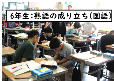
6年生:熟語の成り立ち(国語)