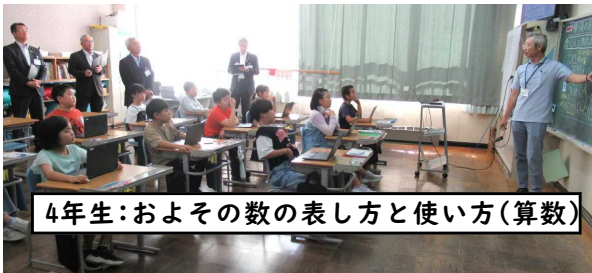
4年生:およその数の表し方と使い方(算数)