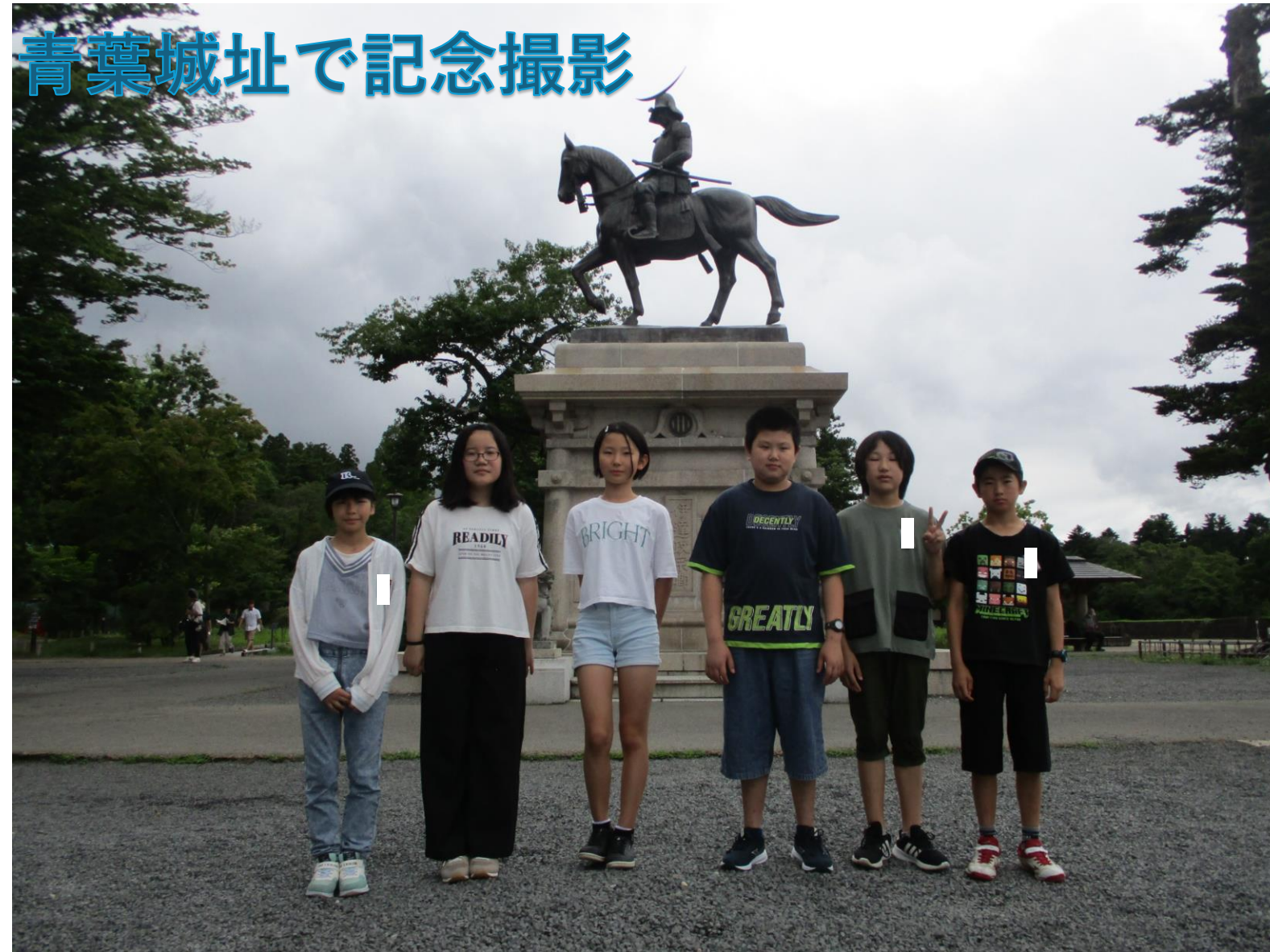
青葉城址で記念撮影