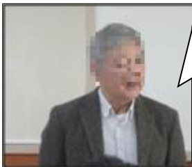
生和堂医院長 □□□□先生

皆さんはこの世で唯一無二の貴重な存在。どんな人にも幸せに生きる権利があるし、ほかの人の幸せを奪ったりしてはいけない。 そのためにも若い時に次の3つの力を是非培って。1. 自己肯定感 2. コミュニケーション力 3. リテラシー(読解力・吟味力)