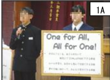
One for All, All for One!

生徒会長のあいさつで始まった生徒総会では、各委員会から今年度主に取り組みたいことについての報告と、それについての質疑応答がなされました。