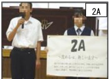
2 A ～改める心 新しい自分～