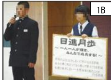
日進月歩～一人一人が輝き、みんなで成長する！～