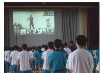
ダンスを習っている生徒もいるようで、動きのよさが光っていました。