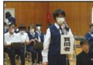
1年生も活動内容について質問してくれました。