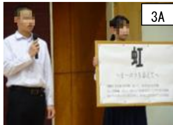
虹 ～オーロラを添えて～