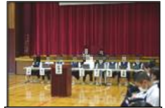
各委員会の委員長が勢揃いさんと□□□□さんです。