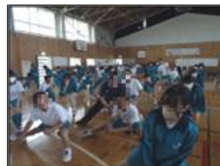
□□先生も健康のため、生徒と一緒にがんばっています。

映像を見ながら全校で曲に合わせて体を動かすのはそれなりの盛り上がりがあり、皆楽しみながらいい汗をかいたようです。