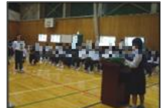
質問者はマイクのところに並んで控えます。