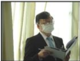
□□□□特別支援教育アドバイザー