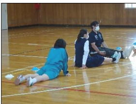
体育の準備運動。T2□□先生と。

指導についていただいたアドバイスは職員で共有し、更に生徒たちにとって楽しく分かりやすい授業となるよう努めたいと思います。