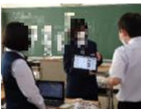
グループで気付いたことを情報交換。