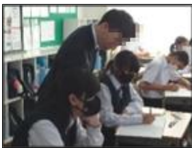
□□専門監が丁寧に学びの様子を見取り。