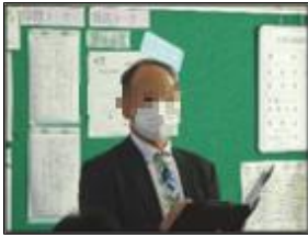
□□□□教育アドバイザー

5月30日（木）に、大仙市教育委員会から2名のアドバイザーがお見えになりました。授業を通して生徒たちの様子をご覧いただき、特別支援教育と学校教育全般についてのアドバイスをいただきました。